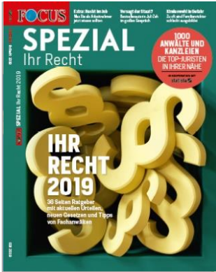
Cover FOCUS-SPEZIAL „Ihr Recht 2019“