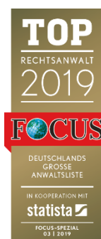
Beispiel-Siegel für die „Top-Rechtsanwälte 2019“