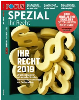
Cover FOCUS-SPEZIAL „Ihr Recht 2019“